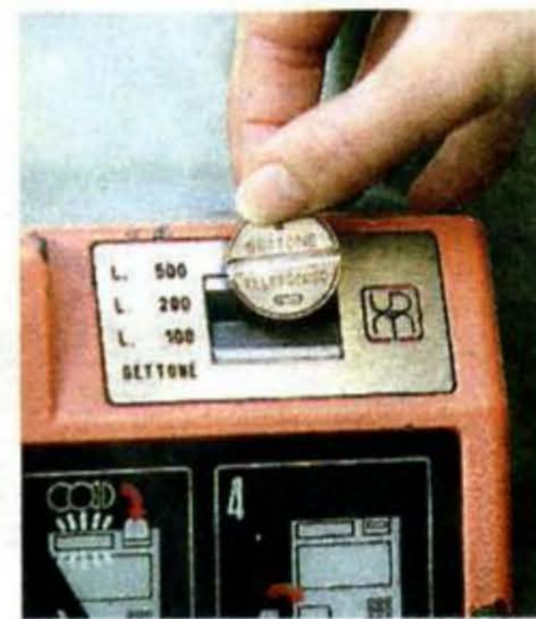
Un telefono a gettoni

confessionale del fedele, qualcosa di mio in quei momenti, di veramente privato. Perché prima c'era il posto pubblico a scatti all'albergo Bardilio, poi in Croce Rossa, dove le cabine c'erano, ma c'era anche gente. Invece là, ai "giardinetti", sulla piazza, c'era la cabina e c'eri tu, con i gettoni. Che magia i gettoni! Che quando lei rispondeva, a seconda della distanza li sentivi cadere in quella sca-