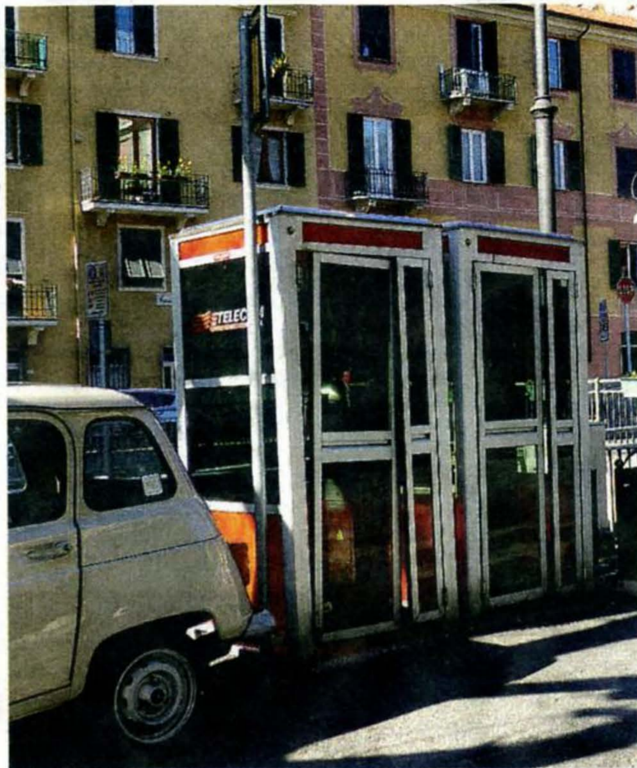
Cabine telefoniche a Rapallo

L'altro giorno un amico fotografo in pensione stava scattando foto di tramonto e ha detto: "Prima andavo in studio, camera oscura, pellicola, filtri, acidi, bagno, vedevo nascere la foto dal nulla, la coccolavo, l'appendevo, la guardavo. Ora scatto, guardo, e via, posso spedire a chiunque, salvo sul computer, su un dischetto. Stop". Gli ho chiesto: "Nostalgia?".